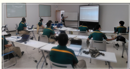
保管荷役事務管理講習会